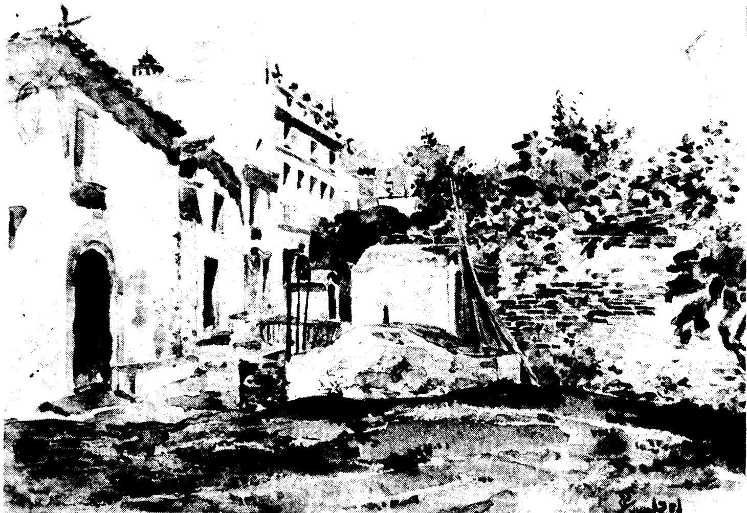
El carrer de Sant Antoni, sector de Llevant de la carretera de Ca la Duana, on els vells pescadors elaboraven el misteriós esquer.

Però el record més persistent d'aquest darrer tros del carrer de Sant Antoni és el de les dues cases fondes del costat de