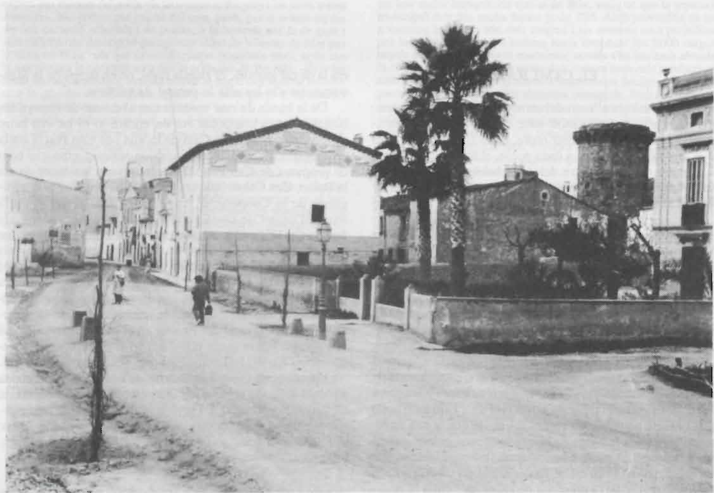
A l'extrem dret de la fotografia es veu part de la façana de Ca la Duana amb el jardí al davant. Tirant cap a Ponent, l'hort de Can Nadal, la Casa de la Vila i el Camí ral tal com el va conèixer l'autor d'aquests records, amb tot el seu encant rural.

Això era de dia, perquè a la nit ni això. Ja no passava cap tren i els carros eren pocs, i la mar a l'estiu estava molt encalmada; només a les darreries de setembre l'engrescava el temporal de «renta-bótes», anomenat així perquè es portaven mol-