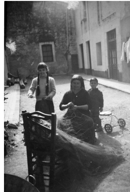
AD. Fons Família Cortés Blanch. AMVM.

L'exposició convida a la participació ciutadana i obre un espai de reflexió sobre el futur de la pesca, marcat pels reptes de la sostenibilitat i els canvis mediambientals.