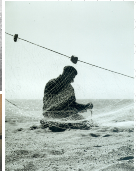
Autor i Fons: Germans López Teixidó. AMVM.