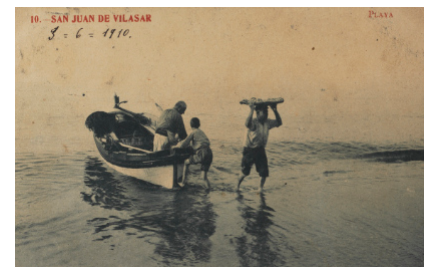
AD. Fons Família Cabot Roig. AMVM.